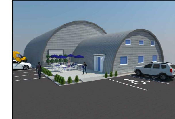
PŘÍKLAD ŘEŠENÍ DOČASNÉHO SOCIÁLNÍHO ZÁZEMÍ