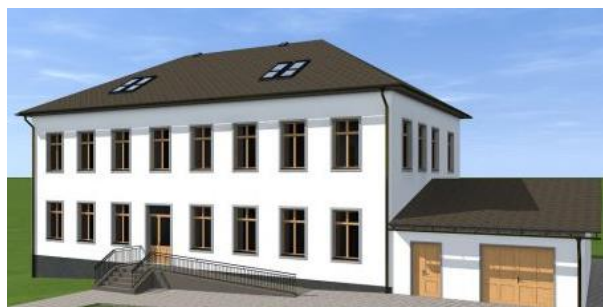
Vizualizace přestavby bývalé školy u kostela

V závěru letošního roku proběhnou výběrová řízení na zhotovitele staveb uvedených projektů. Stavební práce na budovách bývalé školy a obecního úřadu budou zahájeny v roce 2018. V místní části Bukovice bude do konce roku dokončena nová dlažba u hasičské zbrojnice a u staré školy, zde bude také provedeno dřevěné opláštění studny.